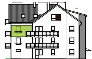
Elewacja tylna - północna