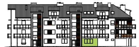
Elewacja wejściowa - północna