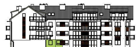
Elewacja tylna - południowa