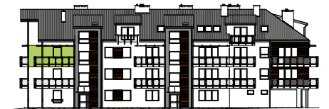
Elewacja wejściowa - północna