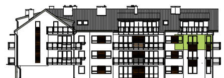
Elewacja tylna - południowa