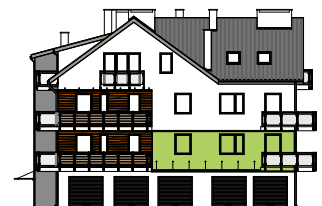
Elewacja frontowa - południowa