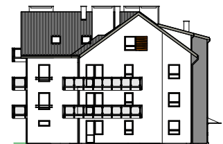
Elewacja tylna - północna