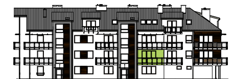
Elewacja wejściowa - północna