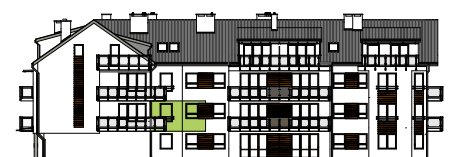
Elewacja tylna - południowa