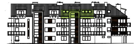
Elewacja wejściowa - północna