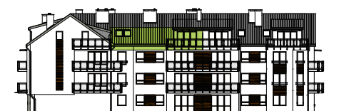
Elewacja tylna - południowa