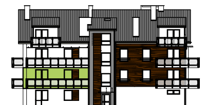
Elewacja boczna - zachodnia