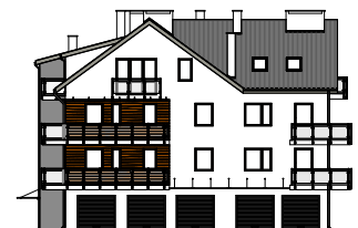
Elewacja frontowa - południowa