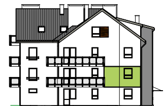
Elewacja tylna - północna