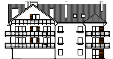
Elewacja boczna - wschodnia