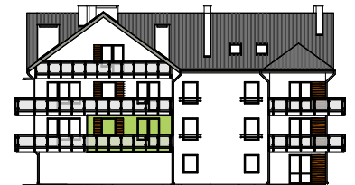
Elevacja boczna - wschodnia