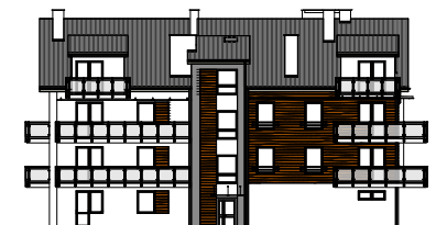
Elevacja boczna - zachodnia