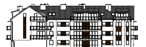
Elewacja tylna - południowa