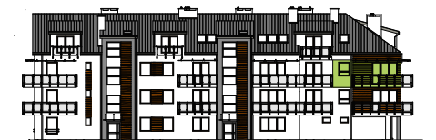
Elewacja wejściowa - północna