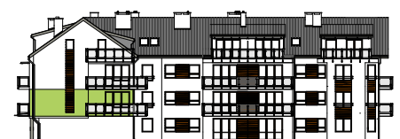
Elewacja tylna - południowa