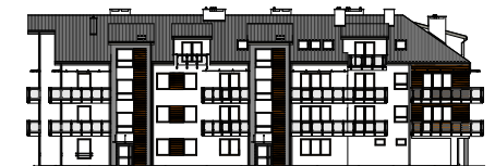
Elewacja wejściowa - północna