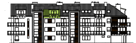
Elewacja wejściowa - północna