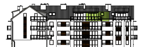
Elewacja tylna - północna