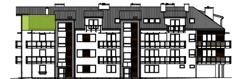
Elewacja wejściowa - północna