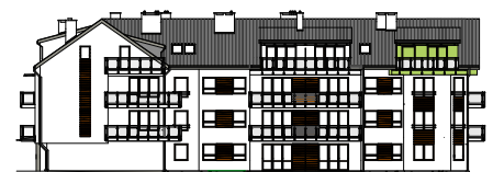
Elewacja tylna - południowa