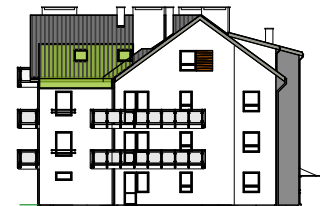
Elewacja tylna - północna