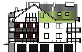
Elewacja frontowa - południowa