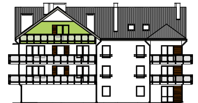
Elewacja boczna - wschodnia